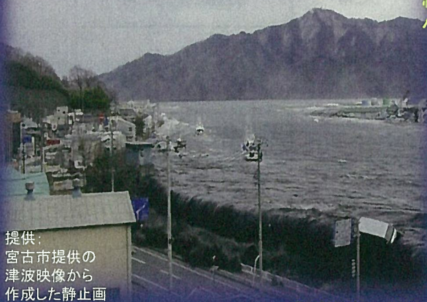
提供： 宮古市提供の 津波映像から 作成した静止画