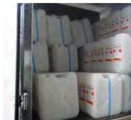
配布される 20L ポリ容器

無機系廃液用 20L ポリ容器とシアン系廃液用 20L ポリ容器は廃液回収時に搬出された容器数分を無料配布しております。配布される容器はエッチング液輸送用容器の再利用品で、処理業者より無償提供されています。この容器は使い捨て（ワンウェイ）使用とし、回収された容器は返却されません。次回使用分として追加の配布にもできるだけ対応いたしますが、用意できる個数には限りがあります。