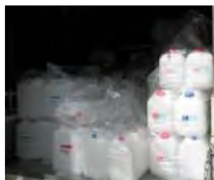
配布される 10L ポリ容器

また、G 分類 可燃性有機廃液 I 用の 10L ポリ容器は廃液回収後の近日中に事前の申込数に基づき無料配布しております。この容器は大学病院から廃棄されている透析液輸送用容器の再利用品です。すべての有機系実験廃液について耐久性が認められているわけではありません。使用中に劣化等の不具合が認められた時は他の容器へ廃液を移し替え、廃液処理センターに使用状況等をご連絡ください。この 10L ポリ容器も使い捨て（ワンウェイ）使用とし、容器返却のための洗浄や輸送コスト等の廃液処理費用の削減と大学病院からの廃棄物量削減を図っています。