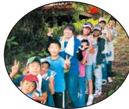
わかたけキャンプ