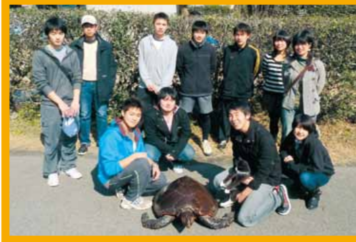
ウミガメ研究会スタッフ (ウミガメの剥製とともに)