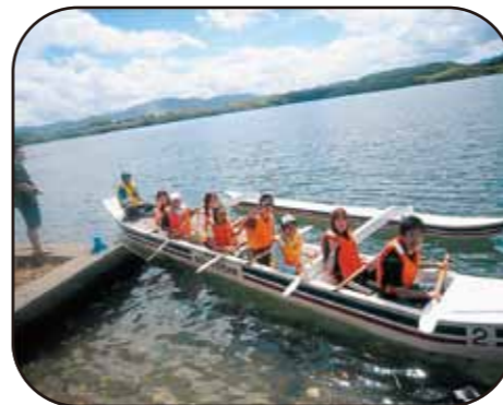
自然体験交流ツアー