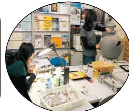
発掘土器の整理作業