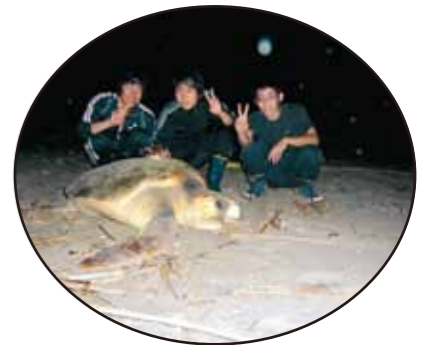
ウミガメの上陸・産卵調査