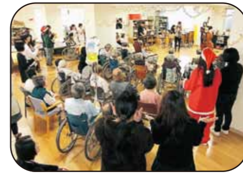
鹿児島生協病院慰問