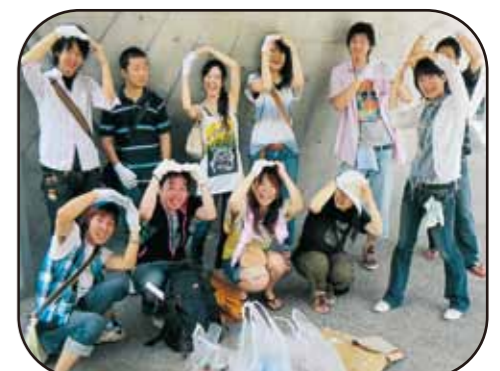
5月30日ゴミゼロの日活動