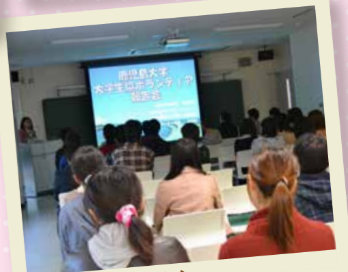
災害ボランティア報告会

鹿児島大学ボランティア支援センター 学生スタッフボララです。 活発に活動している 鹿児島大学の学生によるボランティアを もっと多くの方に知ってもらうために、 私たちが学生目線で企画・作成しています。