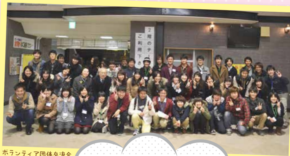
ボランティア団体交流会

KAGOSHIMA UNIVERSITY VOLUNTEER SUPPORT CENTER