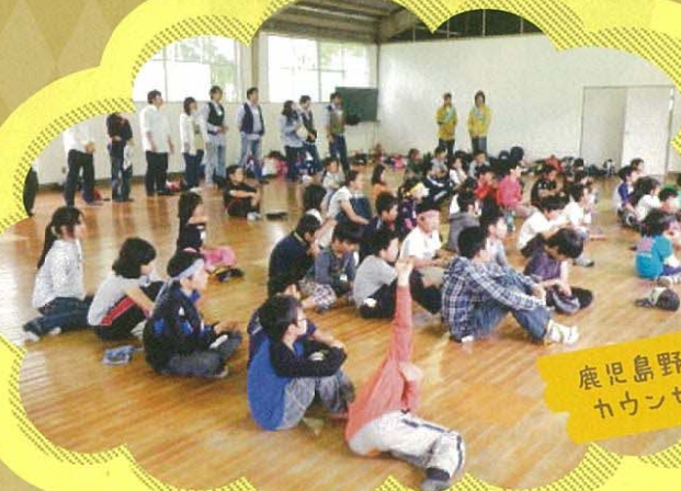
鹿児島野外活動 カウンセラー協会