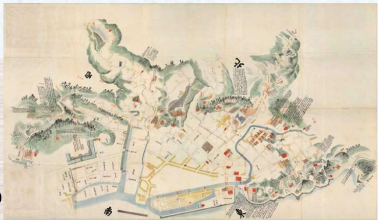
「文政五年鹿児島城絵図」 (鹿児島大学附属図書館蔵・玉串文庫)