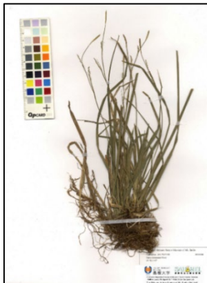
図1. 島根県立三瓶自然館サヒメルに収蔵されている、ダイセンスゲの標本。1995 年に杉村喜則先生(当時島根大学生物資源科学部)によって島根県邑智郡で採取された標本。