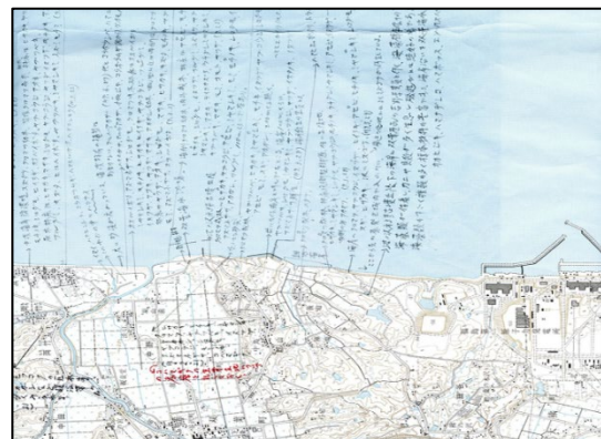
福島第一原発のすぐ近くの浜で採取された植物の採取場所の書かれた地図。標本は福島大学内の標本室に保管されています。