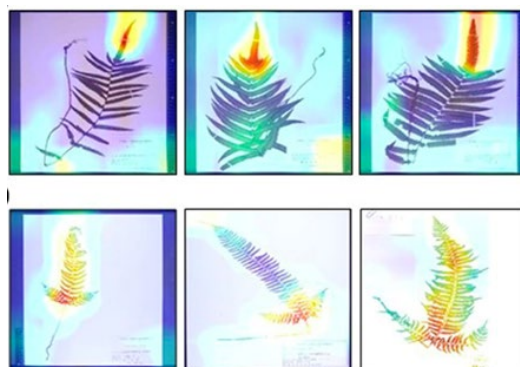
図 8. Grad-CAM という解析をすると、AI がどの部分を見て判断しているかがわかります。上の段はホシダ、下の段はジュウモンジダの解析結果です。人間が同定する際に見ている部分を AI も見ていることがわかりました。

このような画像を用いても AI は種の判定を行うことができました。一方で人間は細かい部位の形態を時には虫眼鏡を使って観察し種を判定することもあります。