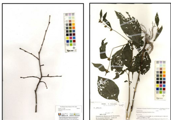
図 5. 標本の中には葉が取れてしまっていないものや、葉に虫食いの穴が沢山空いているものがあります。このような標本約 3 万点を学習対象から外すことで判定成功率が上昇しました。

57万枚の標本画像を収集し、それらを AI 画像認識システムを用いて学習させ、種名を判定するシステムを構築しました。対象となるのは約 2000 種であり、96.4%と極めて高い判定精度で正しい種名を選び出すことができます。こういった標本画像が判定に向かないか(図 5)、専門家がよく間違える種を AI も同じく間違えている事などもわかりました(図 6)。学習に用いた画像ファイルの解像度は低く、細かい部位までは見えませんが、AI は正しく判定できていることがわかりました(図 7)。AI が判定に使った部位を可視化することができる Grad-CAM 解析を行ったところ、人間が判定に使っている部分を AI も使っていることがわかりましたが、種によっては人間が判定には使わない部分を使って判定していることもわかりました(図 8)。鹿児島大学の標本画像の中には竹の定規が写っていますが、これを植物(竹)として認識してしまうこともわかりました(図 9)。学習には高性能のパソコンが必要ですが、島根大学総合理工学部に設置されているパソコンを使うことで、約1週間で解析が終わりました(図 10)。作成した植物の種名の判定システムは http://tayousei.life.shimane-u.ac.jp/ai/index_all.php にて公開しています(図 11)。