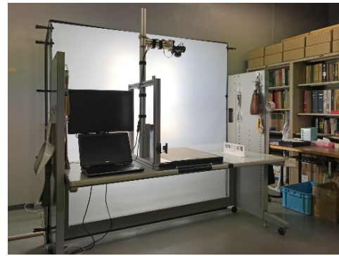
図4. デジタルカメラを用いた画像撮影装置(兵庫県立人と自然の博物館)。