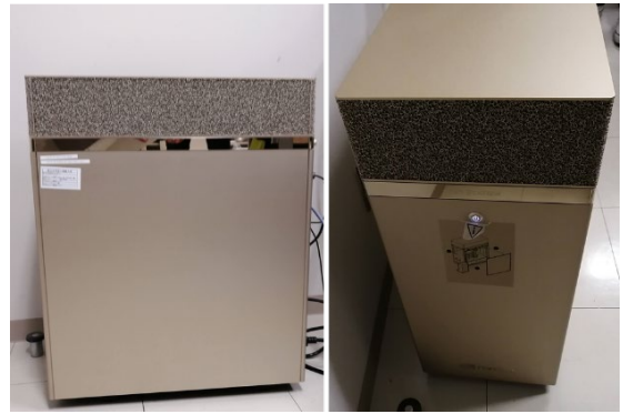
図 10. 57万枚の画像を使って学習を行わせただけに用いた高性能パソコン。島根大学総合理工学部に設置されています。