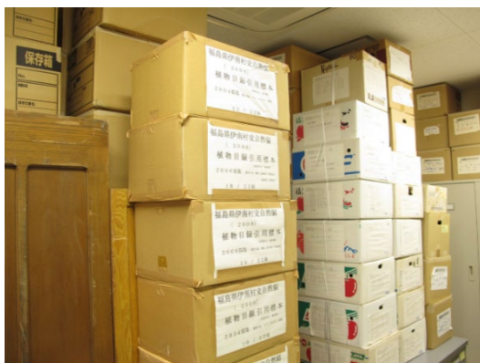
福島第一原発事故により避難した方が所有していた植物標本。現在は、福島大学内の標本室に保管されている。これらもスキャンして画像解析に使用しました。

近年になり画像認識技術が発展し、AI によって人物を特定することなどが可能になっています。AI ならば植物の種名を正しく判定することもできるかもしれないと考えたのが、本研究の背景です。最近では、携帯のカメラで撮影した植物の写真から種名を判定してくれるアプリもたくさん作成されています。これらは身近な植物、特に花を撮影すると高い確率で正解を教えてくれます。一方で、葉だけや茎だけでは判定は難しく、また珍しい植物は判定できません。我々は国内で採集された約57万点の植物標本の画像を使って、種名を判定するシステムを構築しました。このシステムを用いることで、誤同定された標本を選び出すことも可能になりました。