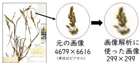
図 7. 学習に用いた画像は 299×299ピクセルであり、もとの画像とくらべると粗いです。

このような画像を用いても AI は種の判定を行うことができました。一方で人間は細かい部位の形態を時には虫眼鏡を使って観察し種を判定することもあります。