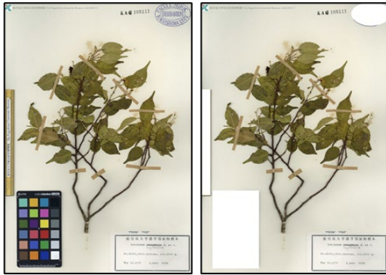
図 9. 鹿児島大学の標本画像には竹の規格が写っています。これを AI は植物だと判断することがありました。そこで、規格、カラーバー、スタンプなどを画像処理によって除去しました。