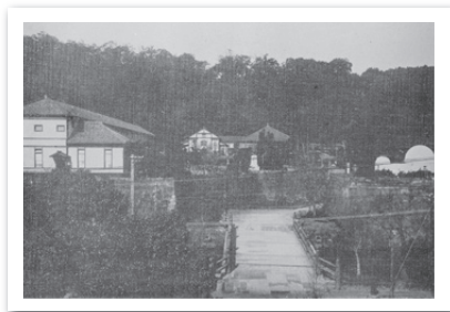
第七高等学校造士館前景