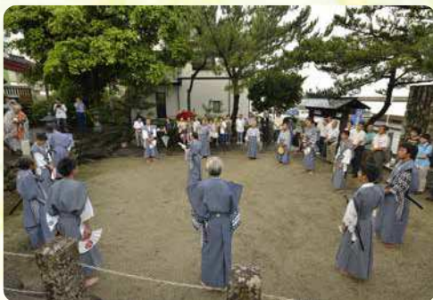
屋久島・如竹踊り