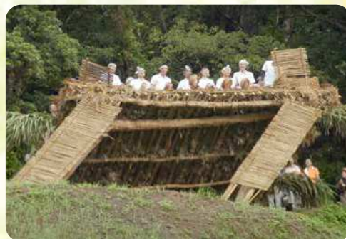
奄美大島・ショチョガマ