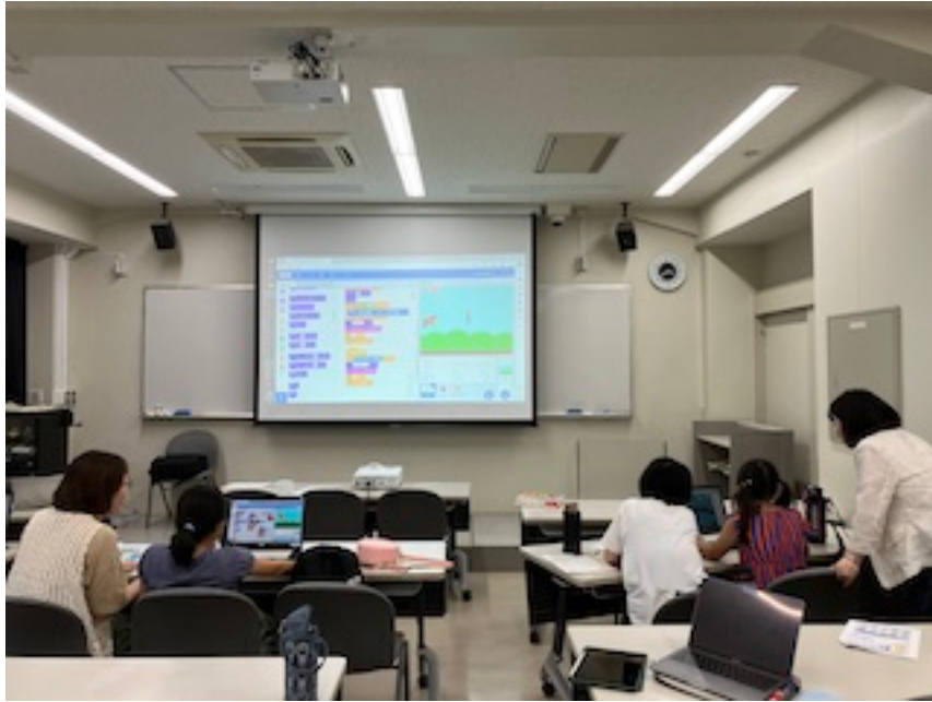
2023年6月24日に行われた親娘ゲームプログラミング教室の様子。