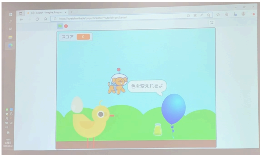
参加小学生が作成したゲーム画面