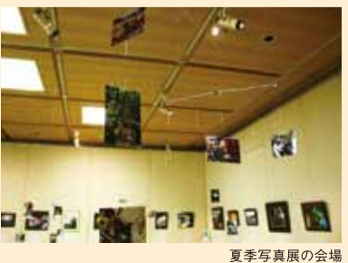
夏季写真展の会場