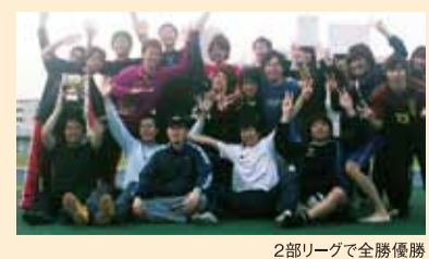
2部リーグで全勝優勝

もしばしば、鹿大祭でも写真展を行います。部員の撮影スタイルや視点はそれぞれ異なりますのでぜひご覧ください。