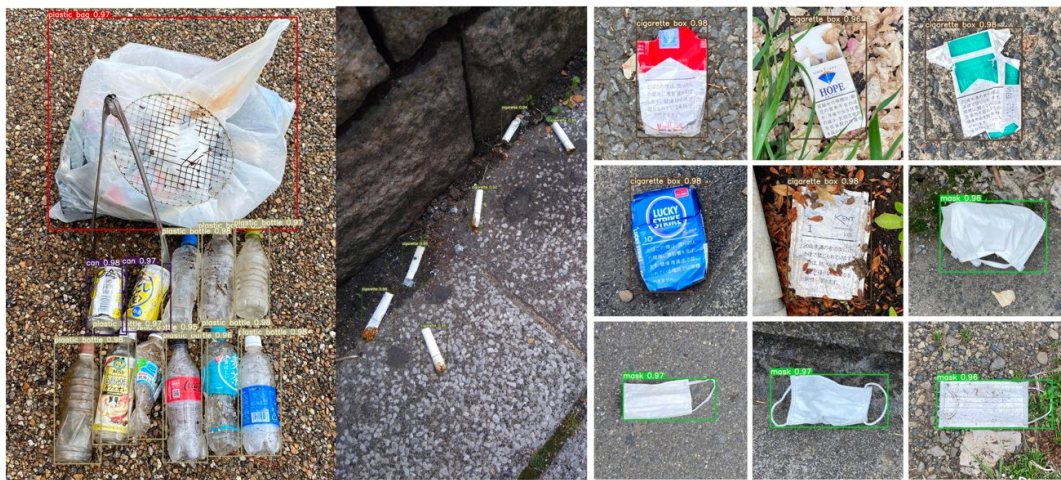
図 1 画像中の街ごみの検出例。ごみ拾い SNS「ピリカ」によって位置情報が得られているので、どこにどのような街ごみが、どの程度あるかを地図上にプロットすることが可能 (Kako et al., 2024, Fig.4 を引用)。