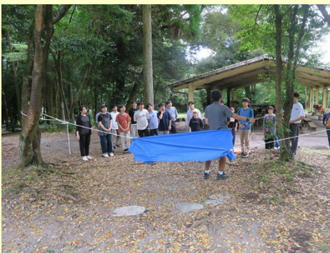
野外生活演習_ロープワーク