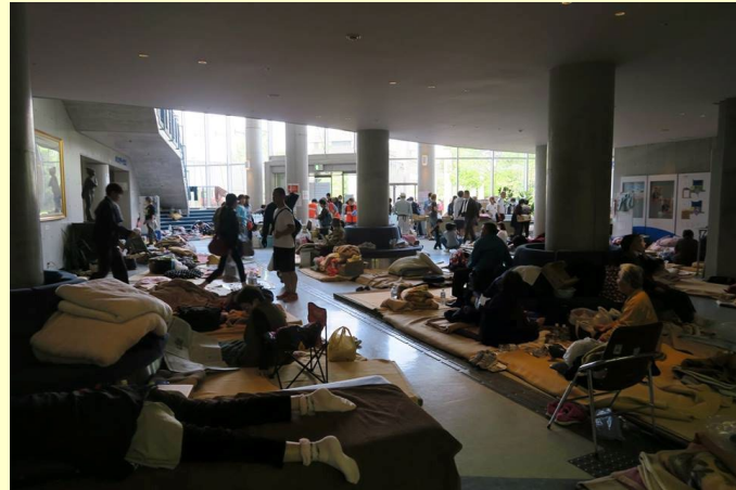
発災1週間後の避難所_熊本地震災害 宇城市にて2016年4月22日撮影