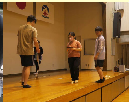
避難所空間の計測調査