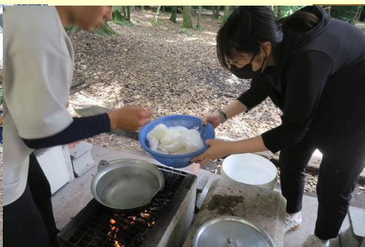
薪の火で野外調理