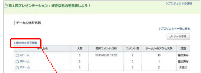
プロジェクトトップ

プロジェクトトップ画面の[提出物を相互閲覧]をクリックして、学生の提出物を確認しましょう。 学生の提出物に対してのコメントを投稿することができます。