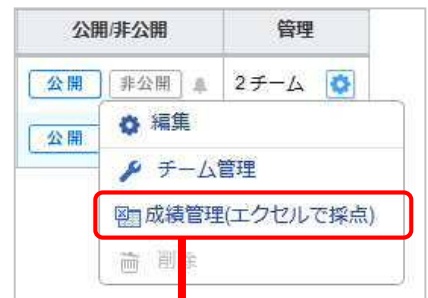
プロジェクト管理画面