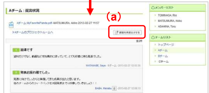
提出物の確認画面