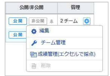
プロジェクト管理画面

! チーム掲示板や提出物(ポートフォリオに追加されたものは除く)も削除されます。また一度、削除したチームは元に戻すことはできません。