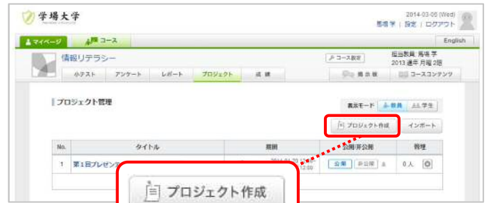
プロジェクト管理画面