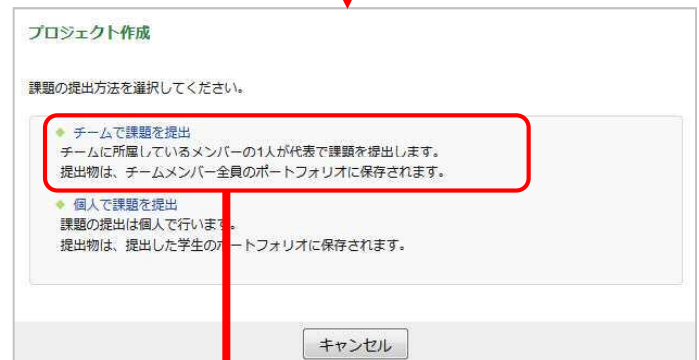
課題提出方法の選択