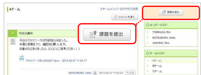
チーム掲示板 (学生画面)