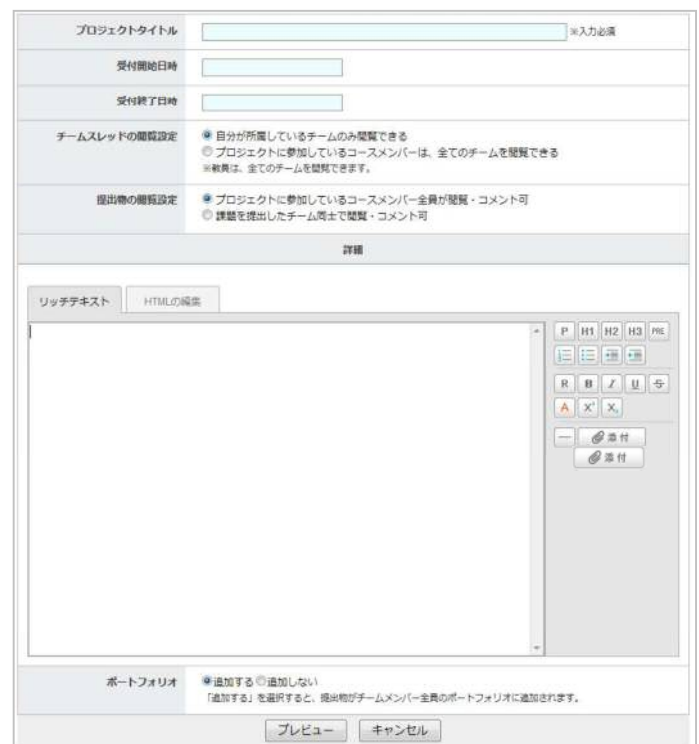
プロジェクト作成画面