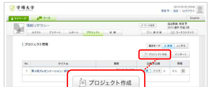
プロジェクト管理画面