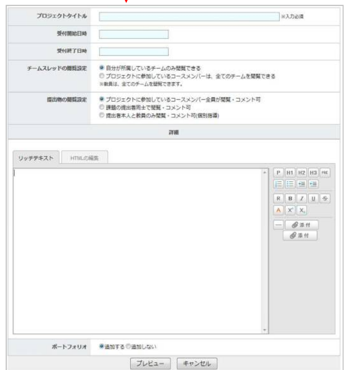
プロジェクト作成画面