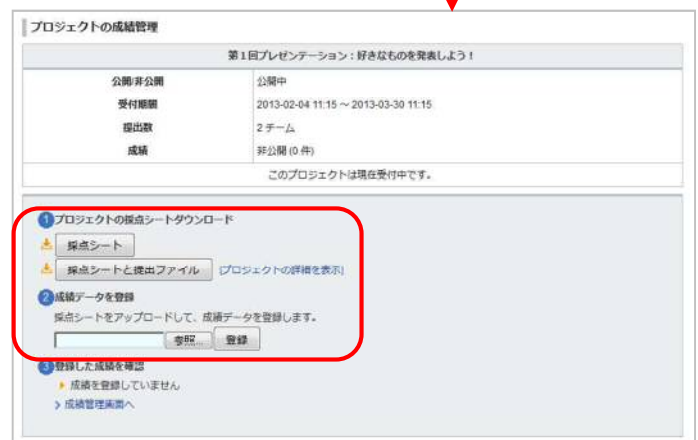
プロジェクトの成績管理画面