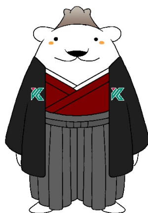
鹿児島大学公式マスコットキャラクター