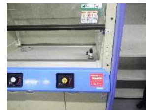
図2 有害物質使用特定施設のシール