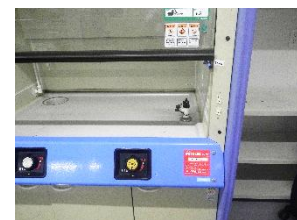
図2 有害物質使用特定施設のシール