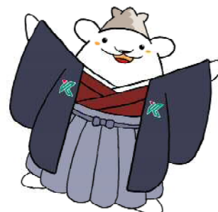
鹿児島大学公式マスコットキャラクター