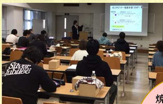
専門的な焼酎の知識を学びます