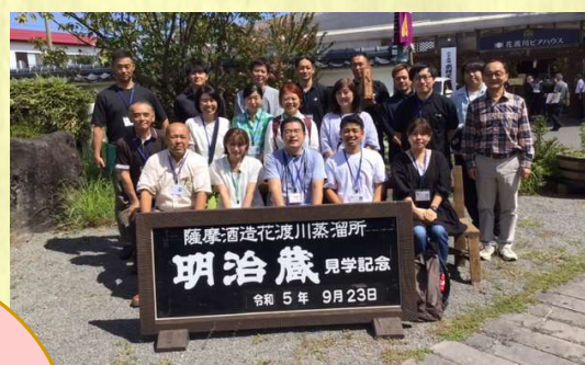
製造研修は大人の遠足です

焼酎について 学べる貴重な時間! 各界で活躍する講師 33名が、あなたの 疑問に答えます