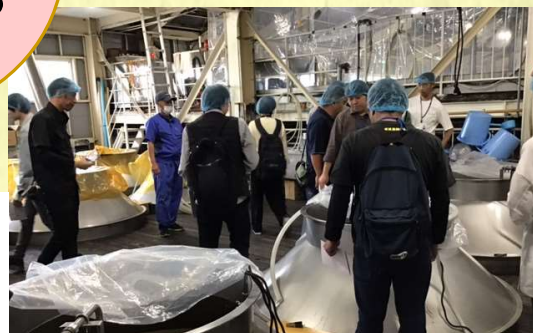
自分の目で見て知識を深めます