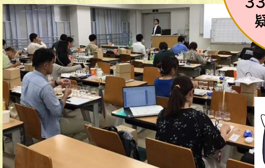
焼酎と料理の相性体験

焼酎について 学べる貴重な時間! 各界で活躍する講師 33名が、あなたの 疑問に答えます