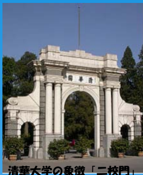
清華大学の象徴「二校門」

鹿児島県では、中国・北京の清華大学で語学留学を行う意欲とチャレンジ精神のある大学生に対し、奨学金を支給します。 中国のトップ大学で、世界中の留学生達と交流してみませんか！