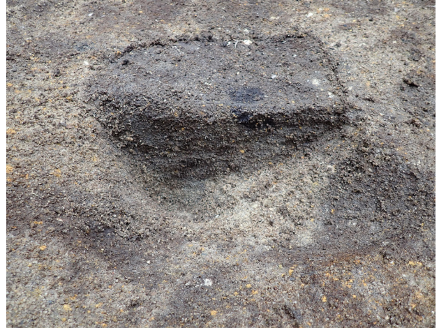
6 2トレンチ P6 埋土半裁