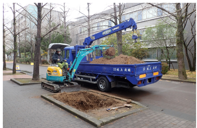
6 8トレンチ掘削 (東から)