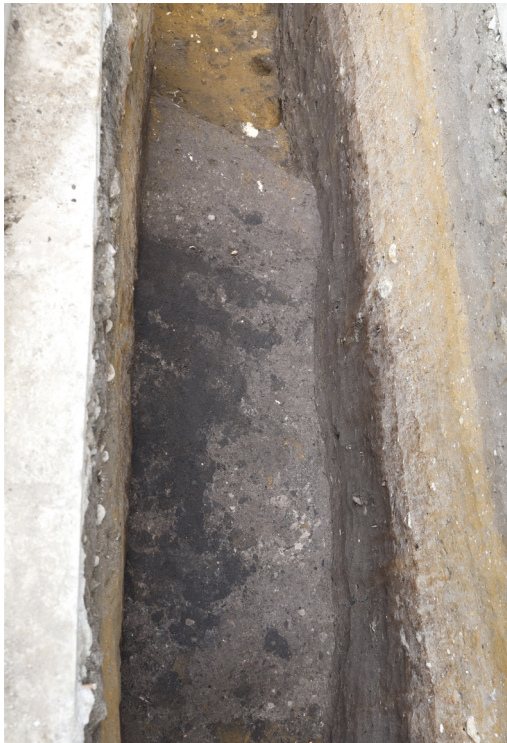
5 H5 検出（西から）