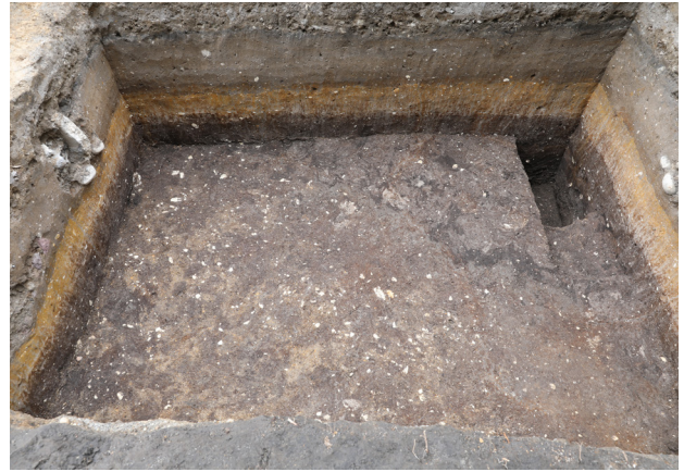
4 2トレンチ6層上面検出状況 (南から)