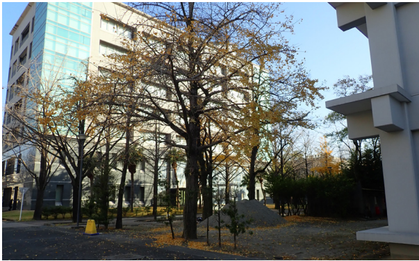
1 1・2トレンチの位置（南西から）