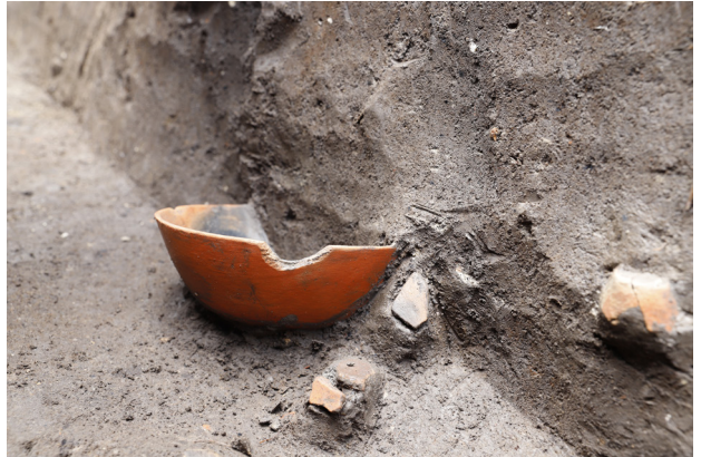
2 H4 土器 (No. 48) 出土状況（西から）