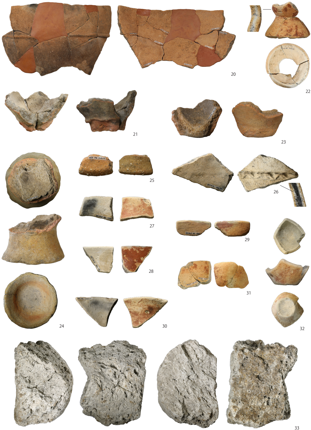
PL. 3 2019-2 H1 出土遺物 (1)