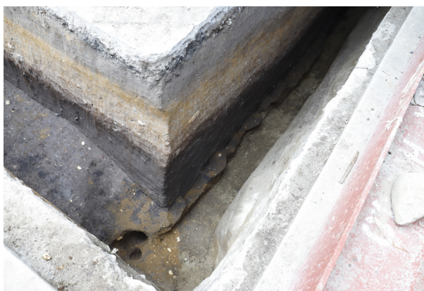
4 H3 掘り床検出 (北西から)