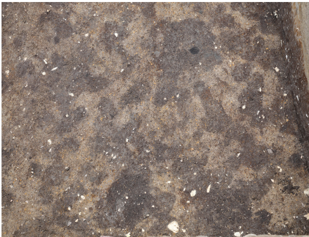
5 2トレンチ7層上面 P4~6 検出 (西から)