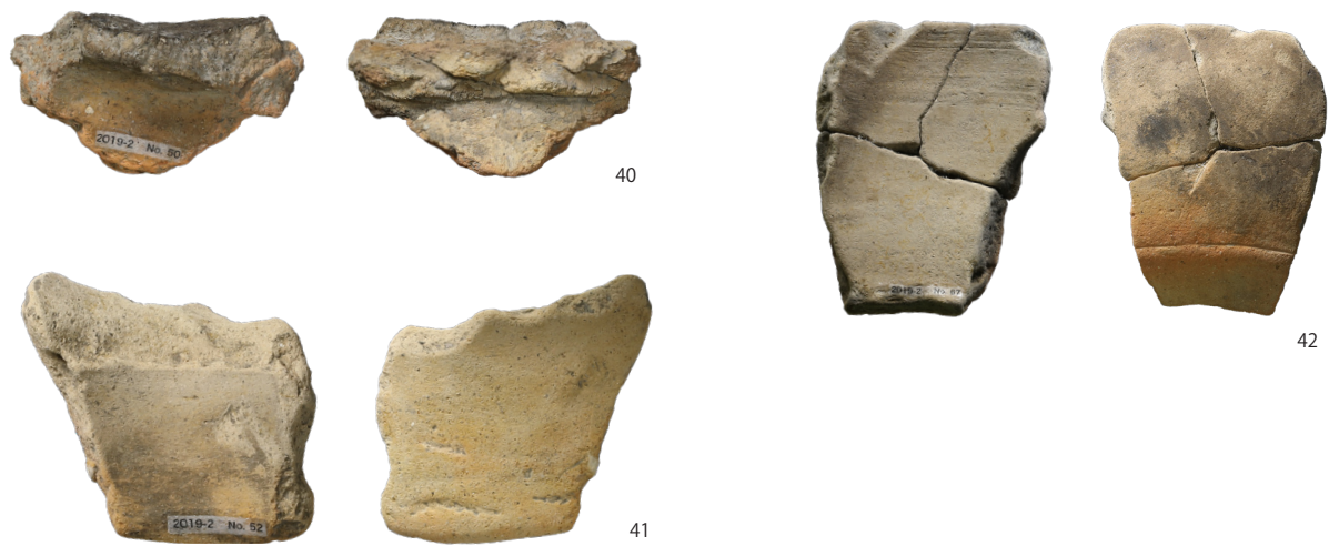
PL. 5 2019-2 H2 出土遺物