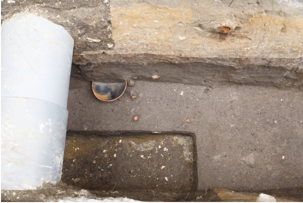
1 H4 床面土器出土状況（北から）