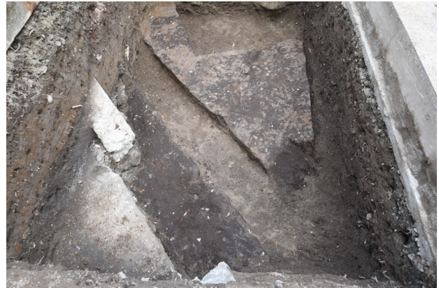
4 6トレンチ4層検出 (西から)