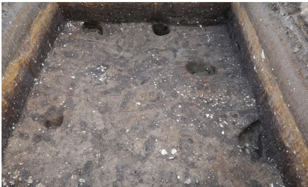
7 1トレンチ7層上面完掘（南から）