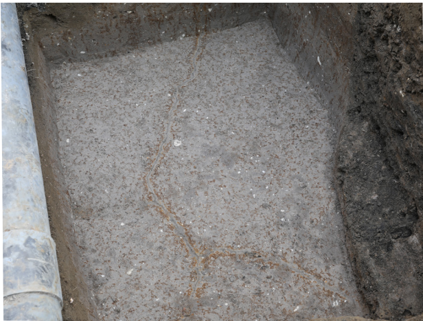
5 7トレンチ4c層上面（南から）