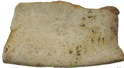
PL. 14 2020-1 1 トレンチ出土遺物