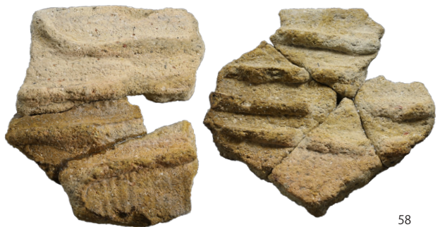
PL. 15 2020-1 2 トレンチ出土遺物