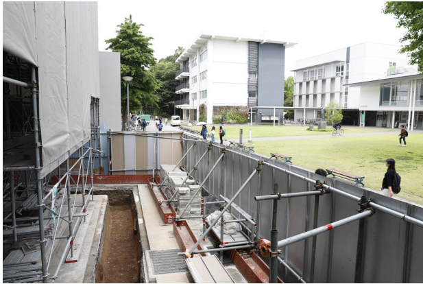
1 調査区とその周辺（東から）