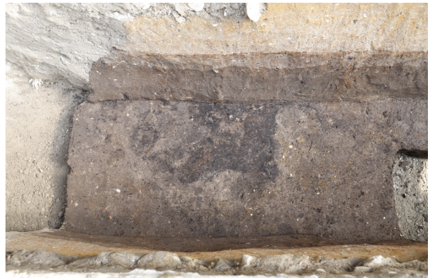
3 H1(東)炭化物層検出(北から)