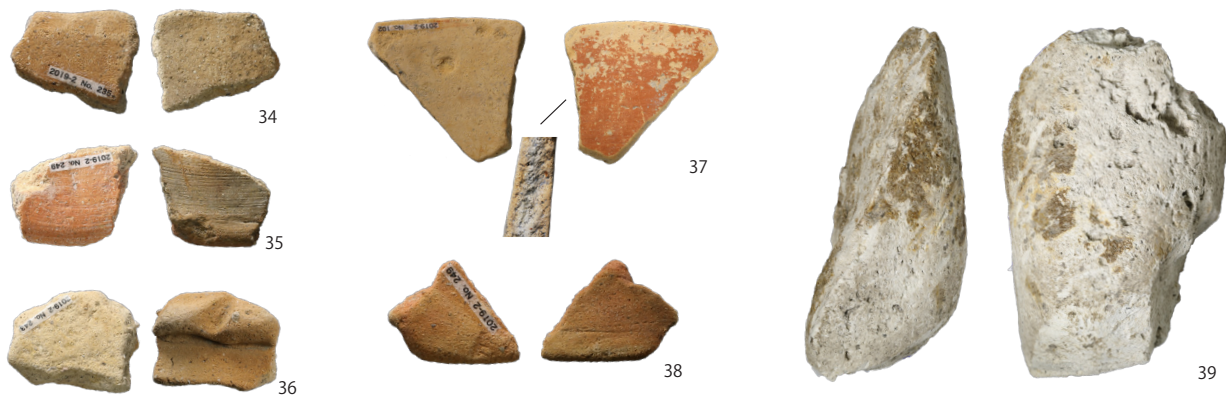
PL. 4 2019-2 H1 出土遺物 (2)