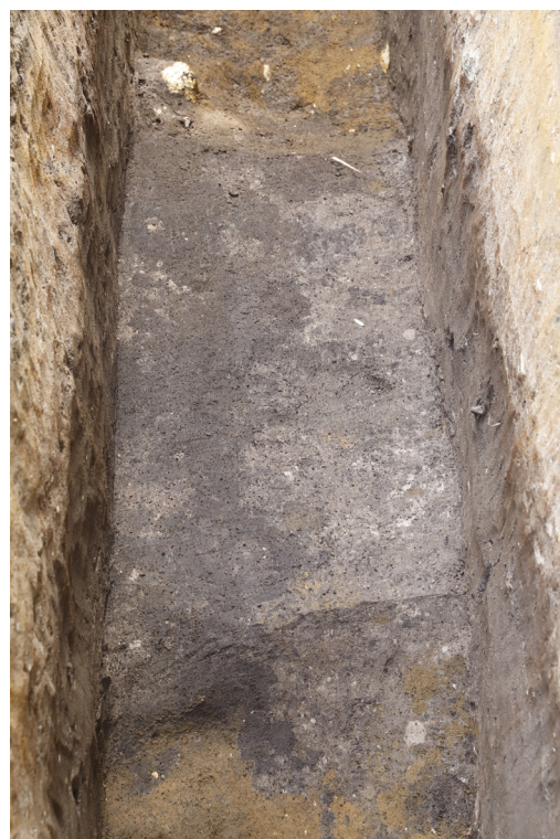
7 H1-2・H3 貼床掘り下げ後 (西から)