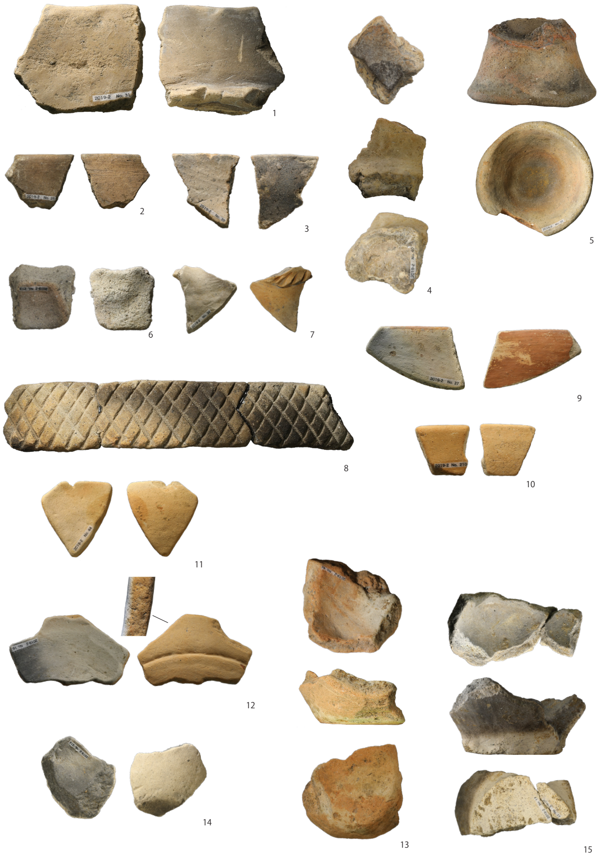
PL. 1 2019-2 5b層出土遺物(1)