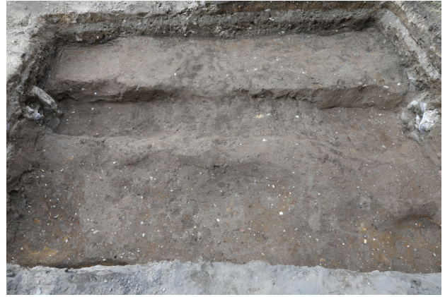
2 2トレンチ表土除去後 (南から)