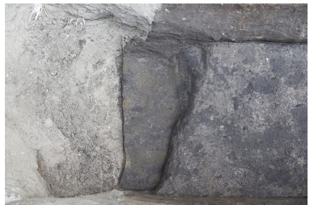
6 SK1 完掘（北から）