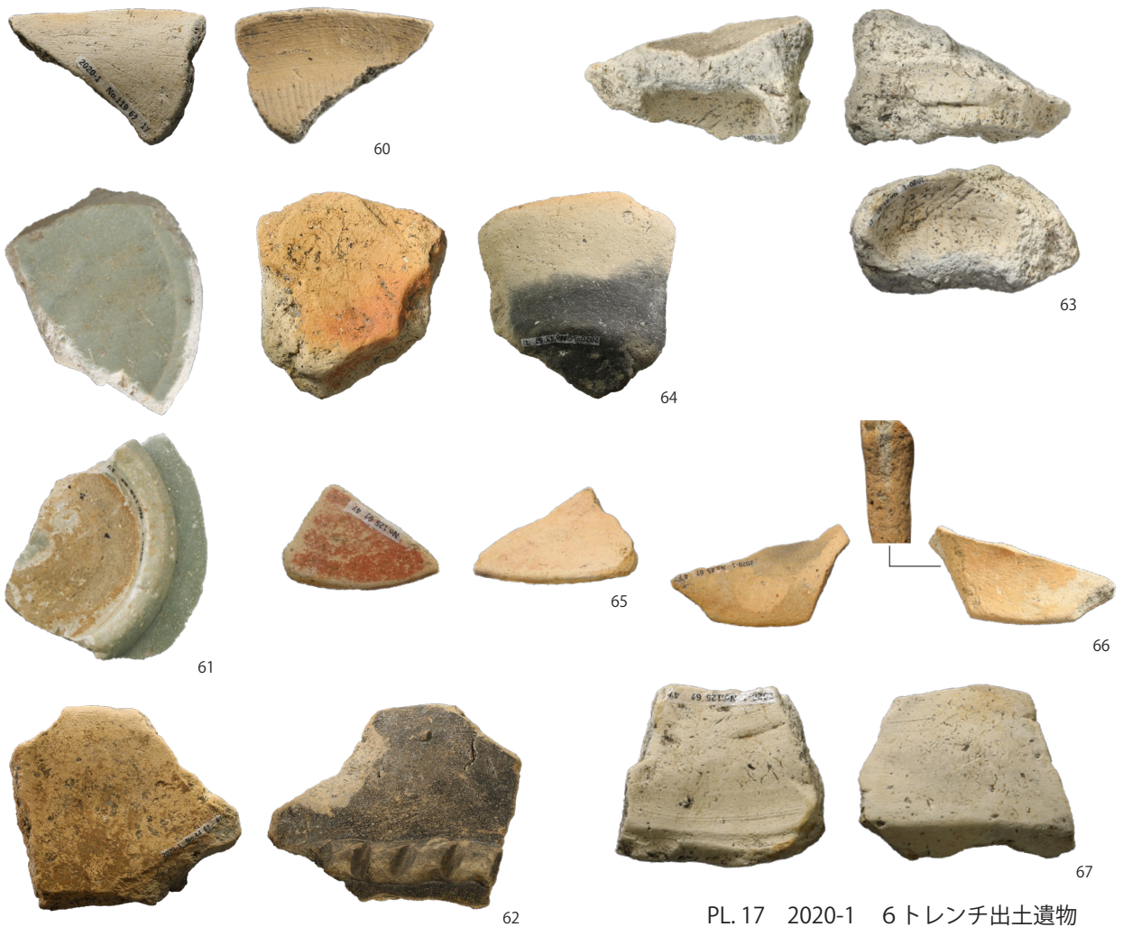
PL.17 2020-1 6トレンチ出土遺物