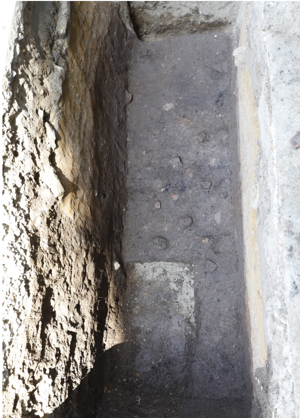
1 H1(東)床面検出(西から)