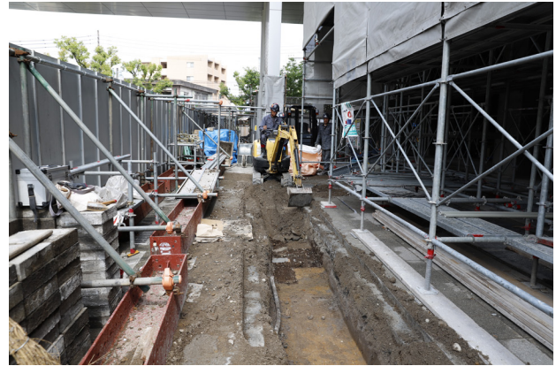
2 2・3区表土除去（西から）