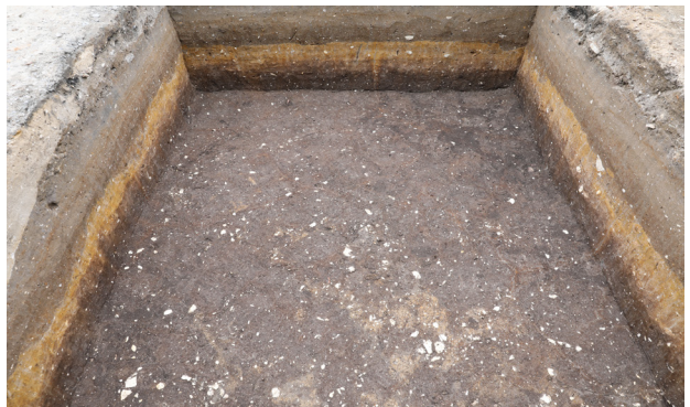
6 1トレンチ6層上面（南から）