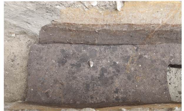
6 H1(東)炭化物層除去後(北から)