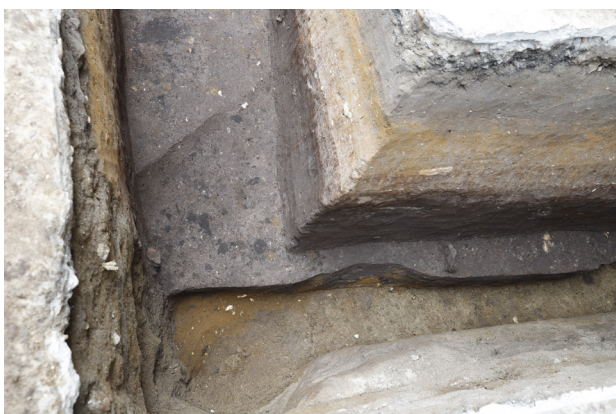
3 H3 床面検出 (西から)