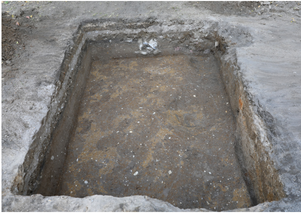
3 2トレンチ3層上面検出 (南から)