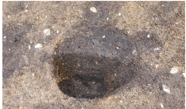
8 P12 半裁