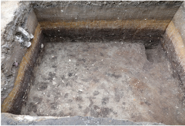
1 2トレンチ7層上面完掘（南から）