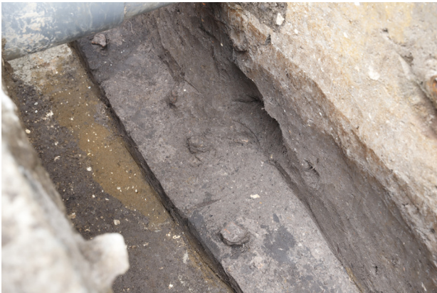
3 H4 床面検出（北西から）