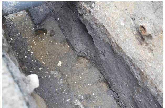
4 H4 貼床完掘（北西から）