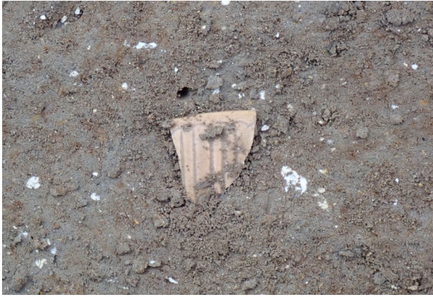
1 1トレンチ3層青磁 (No.51) 出土状況