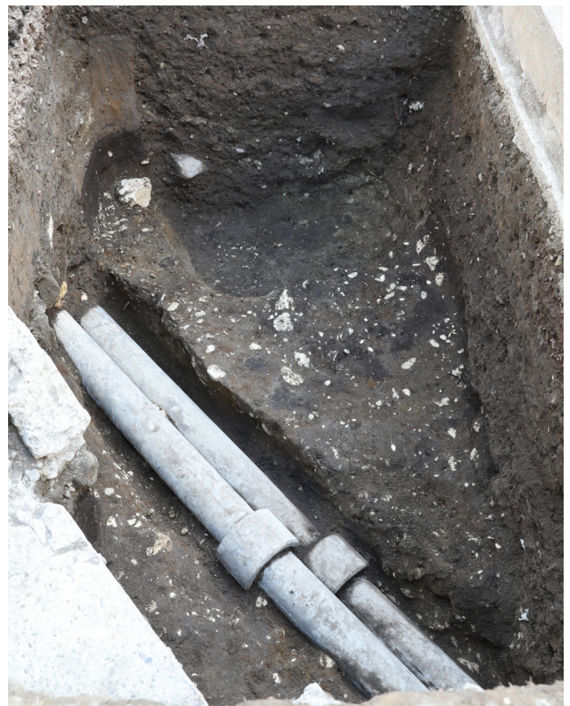
5 6トレンチ完掘 (西から)