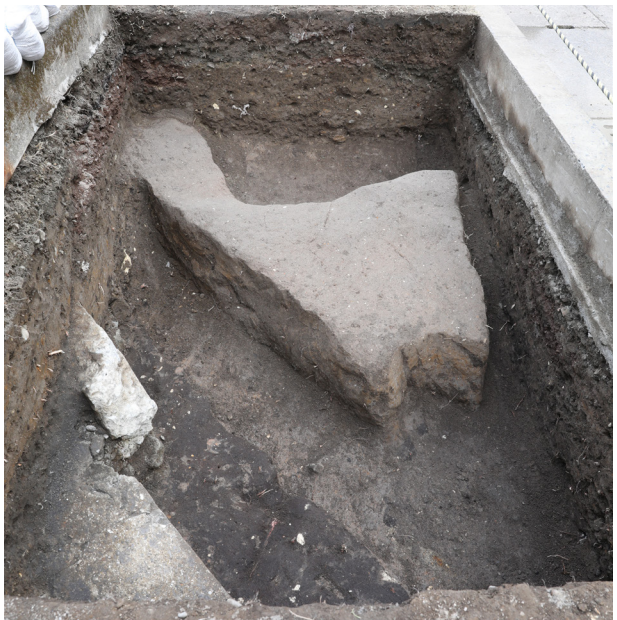
3 6トレンチ2層検出 (西から)