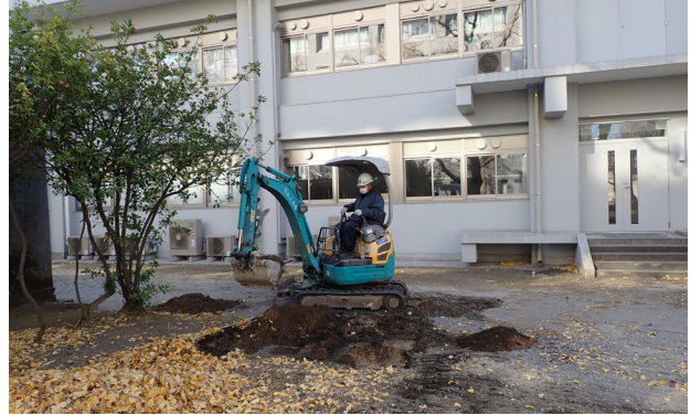
2 2トレンチ重機による表土掘削（北から）