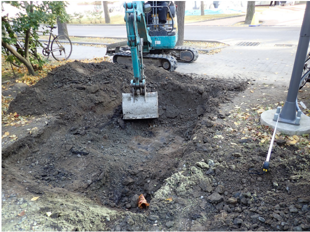
3 7トレンチ表土除去（南東から）