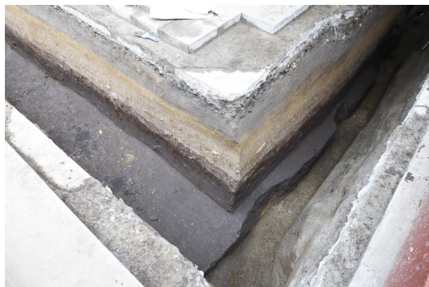
2 H3 検出 (北から)