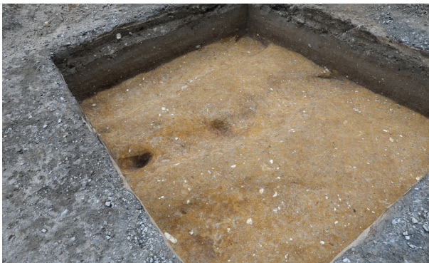
5 1トレンチ4層上面SD1～3完掘（南西から）