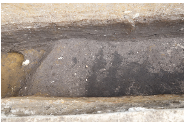
6 H2 埋土掘削後 H1-2 検出 (北から)