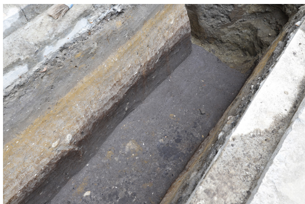
1 H3 検出 (北東から)