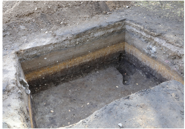
2 2トレンチ完掘（南西から）