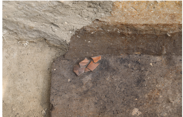
2 H1(東)土器(No.20)出土状況(北から)