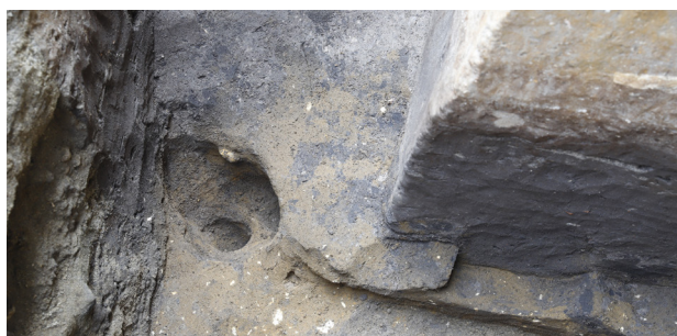
5 H3 内 P2 完掘 (西から)