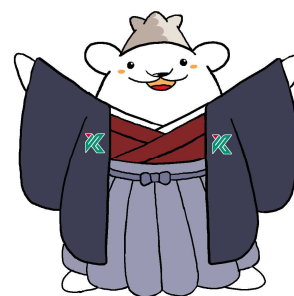
鹿児島大学公式マスコットキャラクター