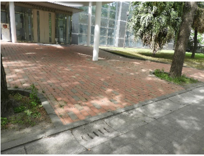
正面入口スロープ※1