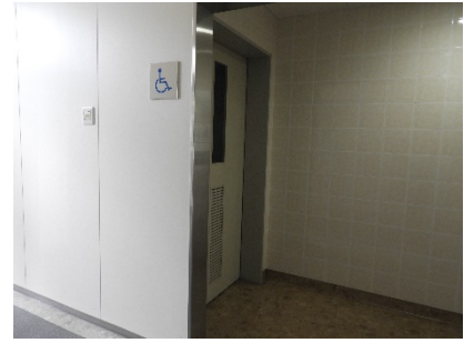
1, 2階みんなのトイレ入口