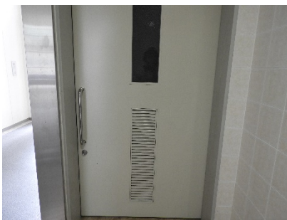
1, 2階みんなのトイレドア