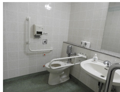
1, 2階みんなのトイレ