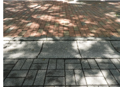
※1 排水溝の蓋が窪んでいます。