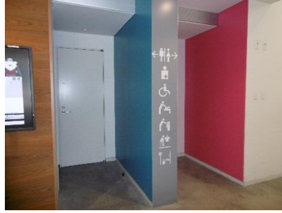
1階福祉型トイレ入口