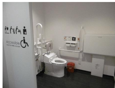
1階女子福祉型トイレ オストメイト対応