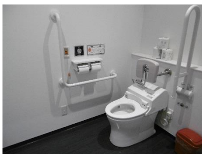
2階女子福祉型トイレ オストメイト対応