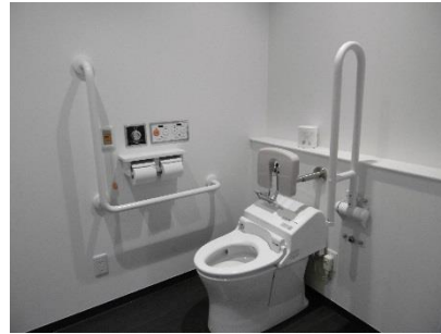
2階男子福祉型トイレ オストメイト対応