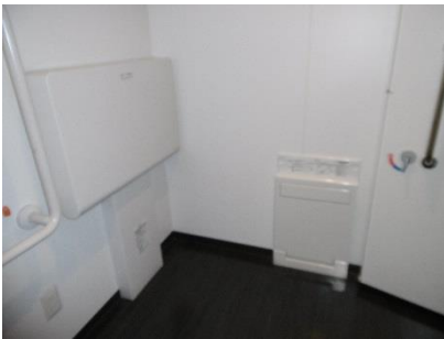
1階男子福祉型トイレ内ベビーベッド フィッティングボード