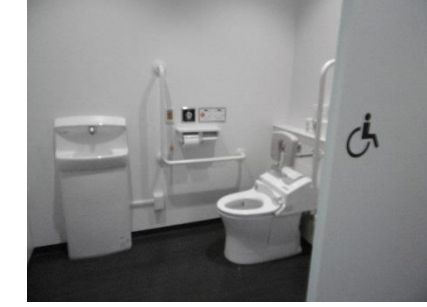
2階男子福祉型トイレ 個室手洗い