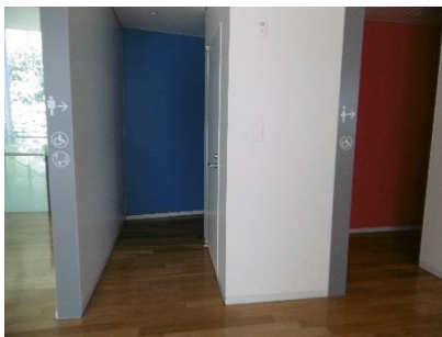
2階福祉型トイレ入口