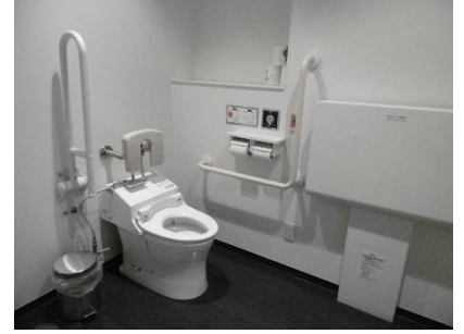
1階男子福祉型トイレ オストメイト対応