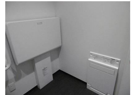
1階女子トイレベビーベッド フィッティングボード