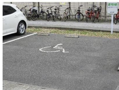
身障者専用駐車場