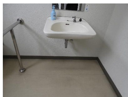
1階みんなのトイレ内手洗い