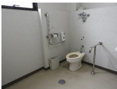
1階みんなのトイレ個室