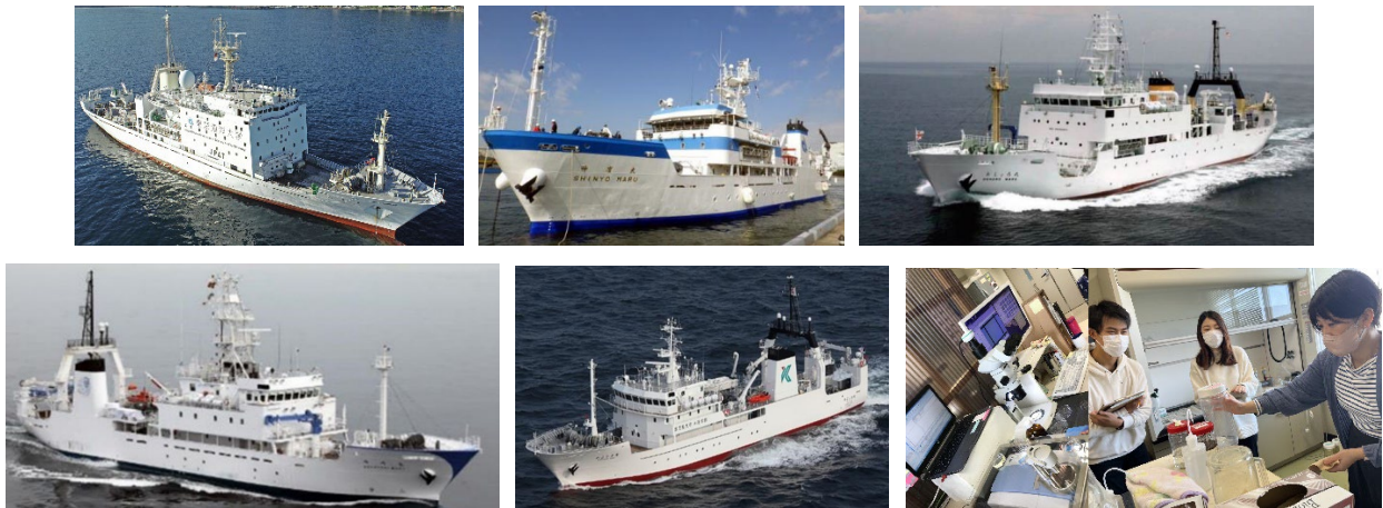
図1 4大学練習船と九州大学のMPs分析室：左上から海鷹丸・神鷹丸・おしよる丸・長崎丸・かごしま丸・MPs分析室